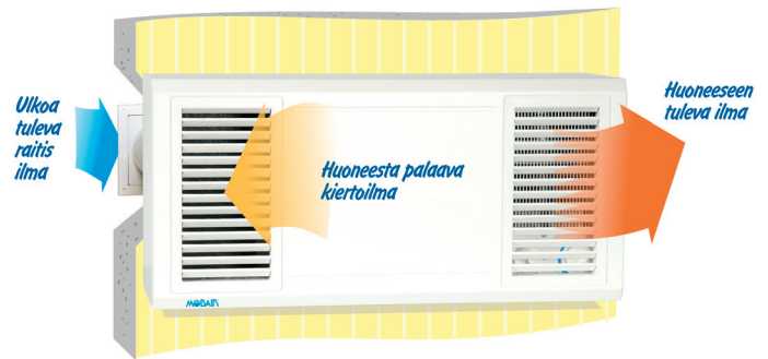
Kuvassa vasenkätinen (tuloilmakammio vasemmalla)